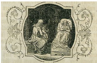
ROĐENJE BLAŽENE DJEVICE MARIJE-MALA GOSPA

U petak 8. rujna slavimo rođendan najljepše žene. Marija je najljepši dar našega Gospodina našoj zemlji: ures našega roda, jedini savršeno čisti cvijet čovječanstva, najljepše djelo Božjih ruku. Bijela nevinost djevice i sveto dostojanstvo majke, cvjetno proljeće i plodna jesen - to je Marija, s Bogočovjekom u krilu. Nebo je samo za nju reklo da je "blagoslovljena među ženama." Zato pred tim čudom čistoće, ljepote i svetosti kleče stoljeća—slave rođendan najljepše među ženama.